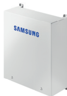
Řídicí Sada EHS Mono

Pro prostorové vytápění a ohřev TUV s externím zásobníkem je možné zvolit variantu s vnitřní řídicí sadou tepelného čerpadla EHS Mono.